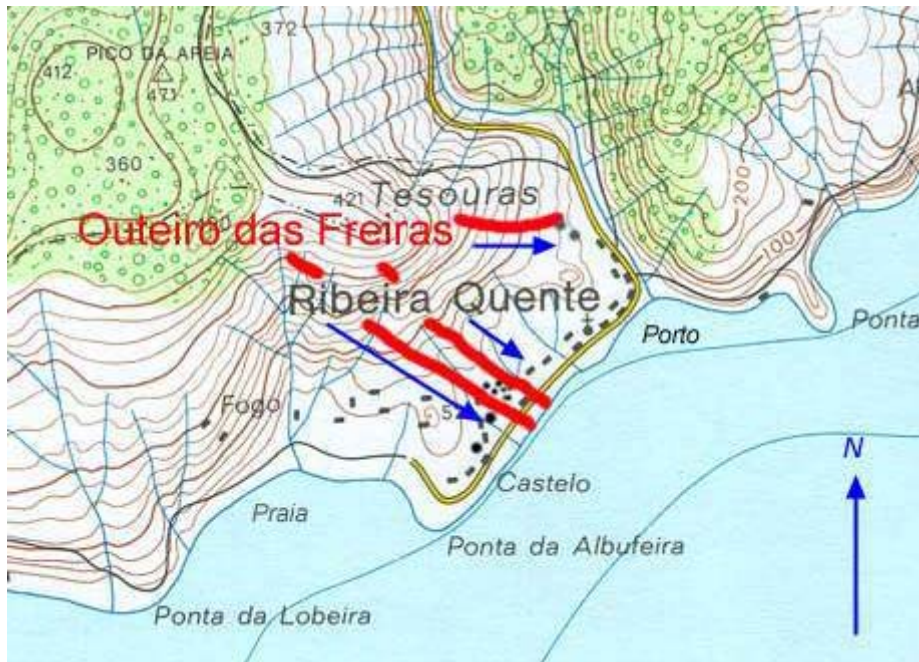
Fig. 1 - A encarnado estão assinalados os escorregamentos de terras ocorridos a 31 de Outubro de 1997. A Ponta da Albufeira foi formada pelo gigantesco escorregamento de terras que em 1630 atingiu o mar na zona do Castelo.